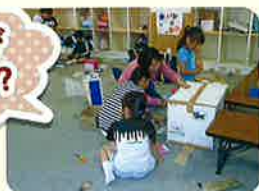
指導員の先生と一緒にみんなで何やら制作中。(^-^)