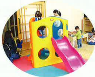
いろんな遊具もあるよ (^-^)

昨年4月に開放的な創りに建て替えられました。遊戯室の高い天井は特徴のひとつです。