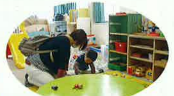
どのおもちゃで遊ぼうかな?

1日平均120～130名程の児童が利用しています。今年の4月に大久保子育て支援センターも館内に入りました。